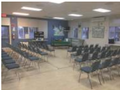
Groupe Vivre heureux, LACHUTE