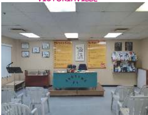
Groupe Anonyme VICTORIAVILLE