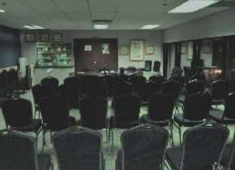
Groupe Sillery SAINTE-FOY