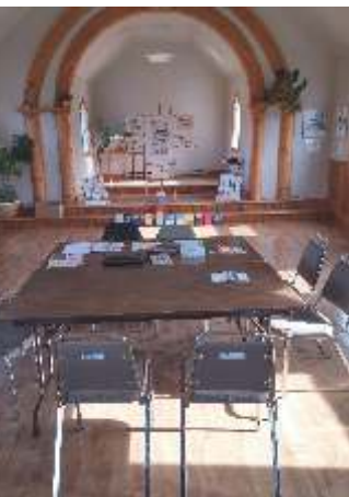
Groupe Mercredi Liberté CAP-AUX-MEULES

Sur cette page, nous publions des photos des salles où les membres, nouveaux et anciens, sont accueillis à bras ouverts et comblés d'amour fraternel.