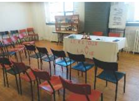
Groupe retour à la vie SOREL-TRACY

Important: Joindre à votre photo votre nom, le nom et la localisation du groupe.